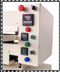
NA - 152