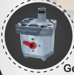
Gear Pump (إيطالي)