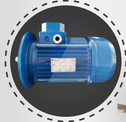
Motor (إيطالي 1700 دورة)