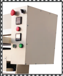
NA - 151

يتميز نظام التوقيتين بكبس حشوات الدبل وكبس حشوات الجبوز دون الحاجة الى تغيير الوقت